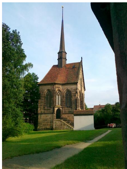
Evangelische Kulturstiftung Goerlitz Schlaurother Str. 11, 02827 Görlitz

E-mail: wang@wang.com.pl http://www.wang.com.pl/